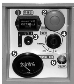
車体側操作パネル