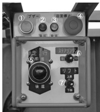
作業床側操作パネル